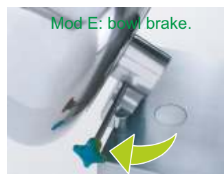
Mod E: bowl brake.

MIXERS MENGER PÉTRINS MÉLANGEURS MENGMACHINES MIXERE IMPASTATRICI AMASADORAS MEZCLADORAS MIX35E•MIX35P MIX60E•MIX60P MIX80E•MIX80P MIX100E•MIX100P MIX150P•MIX200P M I X 2 7 5 P