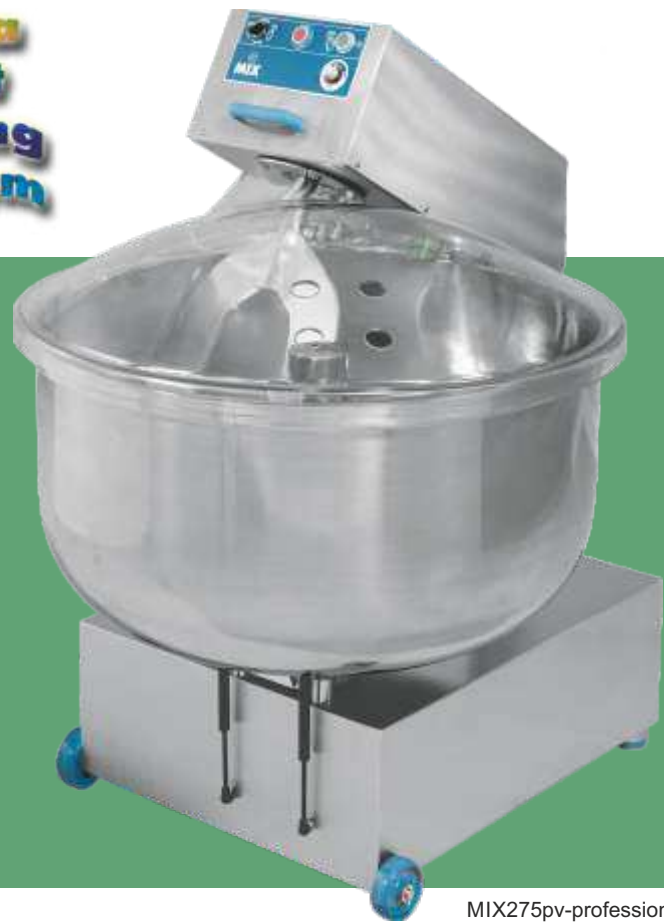
MIX275pv-professional, 2 motors, optional V-electronic variable blade speed

MIXERS MENGER PÉTRINS MÉLANGEURS MENGMACHINES MIXERE IMPASTATRICI AMASADORAS MEZCLADORAS MIX35E•MIX35P MIX60E•MIX60P MIX80E•MIX80P MIX100E•MIX100P MIX150P•MIX200P M I X 2 7 5 P