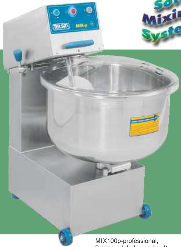
MIX100p-professional, 2 motors (blade and bowl)