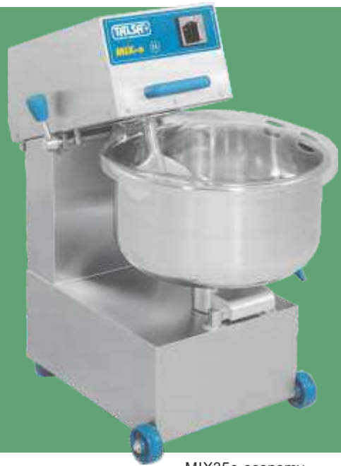
MIX35e-economy, 1 motor (blade)